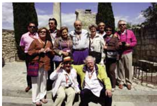
Groupe de congressistes