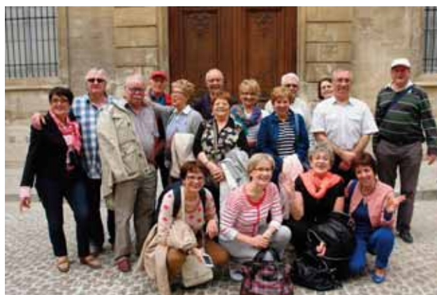
Groupe de congressistes