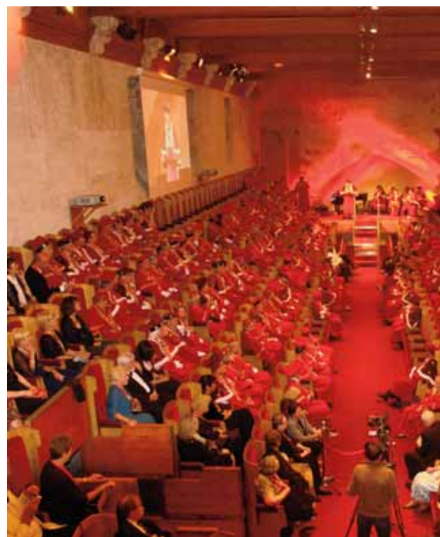
Le Chapitre Magistral