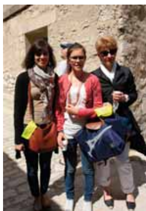
Merci de votre aide