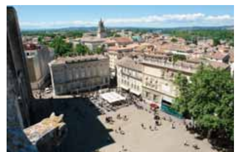
Vue d'en haut