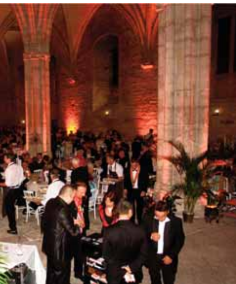
Gala salle .....