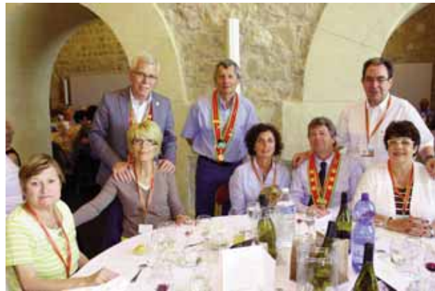
Congrèssistes à table