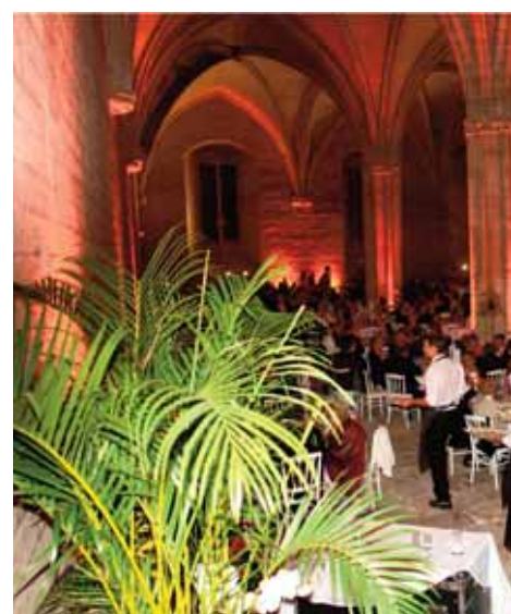
Repas de Gala sa