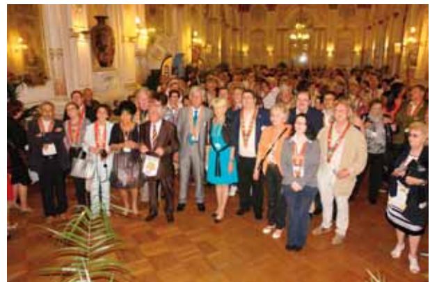
Tous à l'écoute.