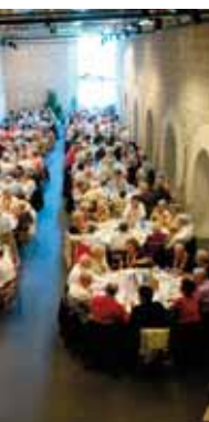
A table !