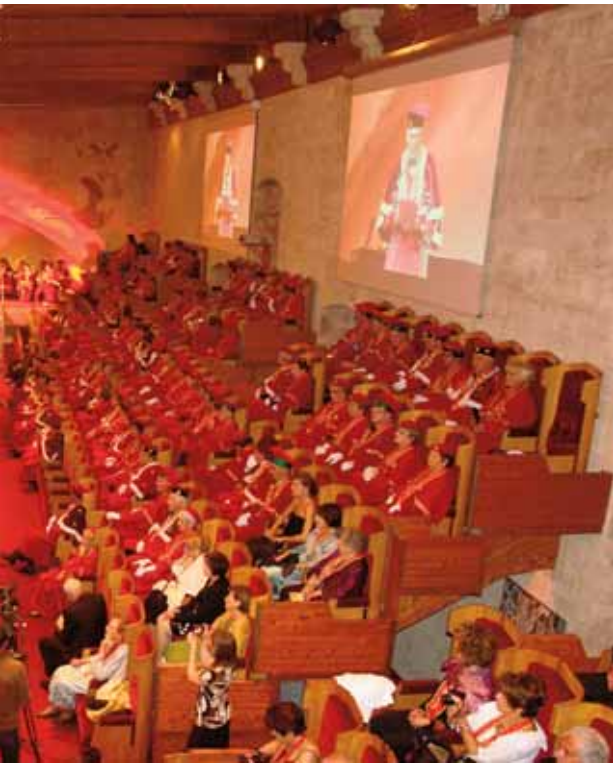
gistrat dans la salle .....