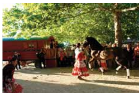
La belle et la bête.